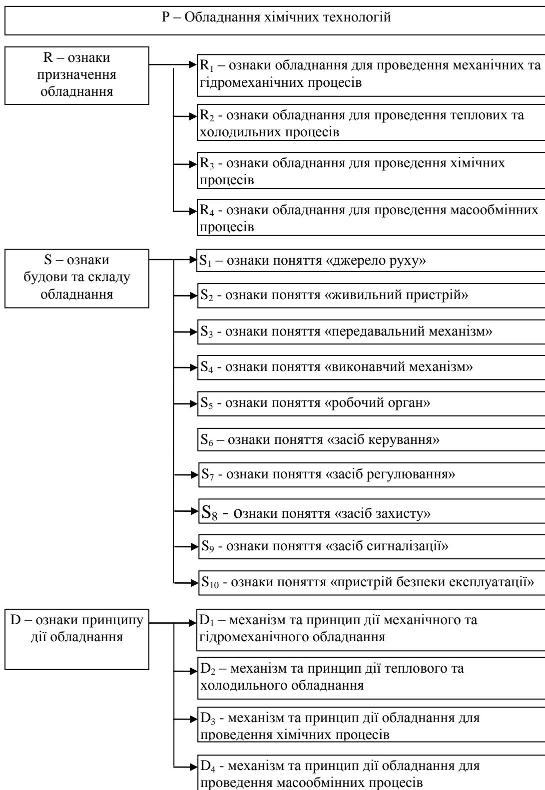
Рис. 2. Концептуальна модель поняття «Обладнання хімічних технологій»: призначення, будова та принцип дії